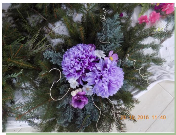
Fot.4. Stroik nagrobny