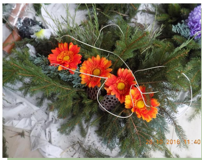
Fot.2. Stroik z gerberów