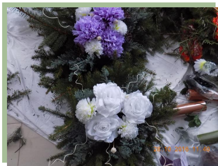
Fot.3. Stroiki w odcieniach bieli i fioletu