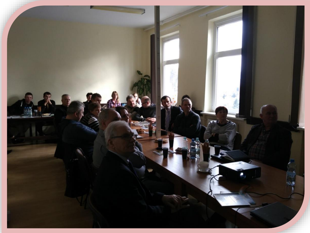
Fot.2. Zgromadzenie uczestnicy