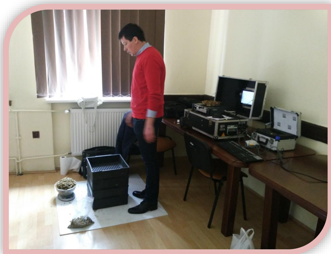
Fot.3. Badanie na sitach Penn State