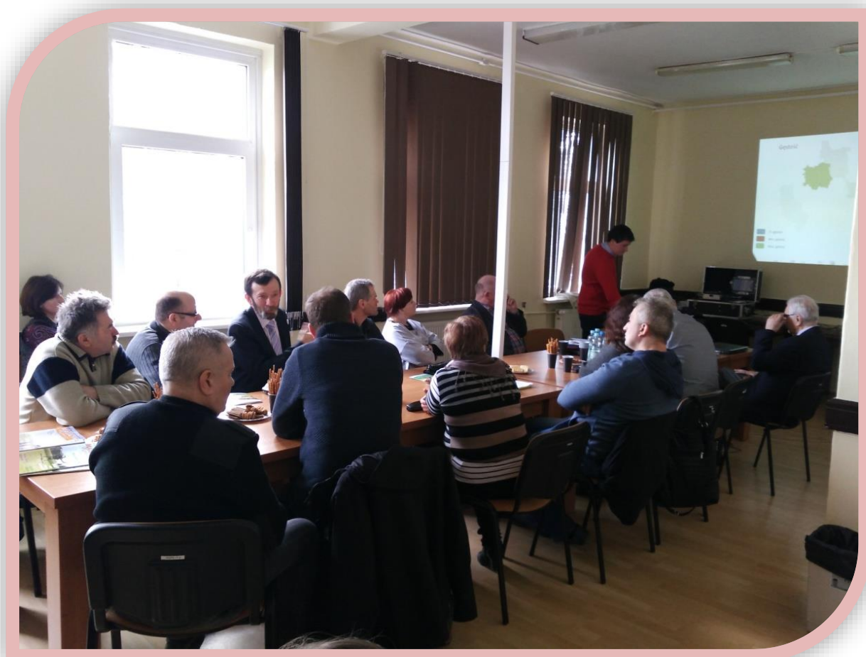
Fot.1. Zgromadzeni uczestnicy szkolenia

Podczas szkolenia szczegółowo przedstawiono wszystkie aspekty związane z uprawą kukurydzy, aby otrzymać dobrą kiszonkę. W drugiej części spotkania odbyło się badanie próbek kiszonek, które dostarczyli zgromadzeni hodowcy bydła mlecznego. Po przeprowadzonej analizie okazało się, iż najczęściej spotykanymi wadami była zbyt wysoka sucha masa kiszonki, wynikająca ze zbyt późnego zbioru i niedostatecznie rozgniecione ziarno.