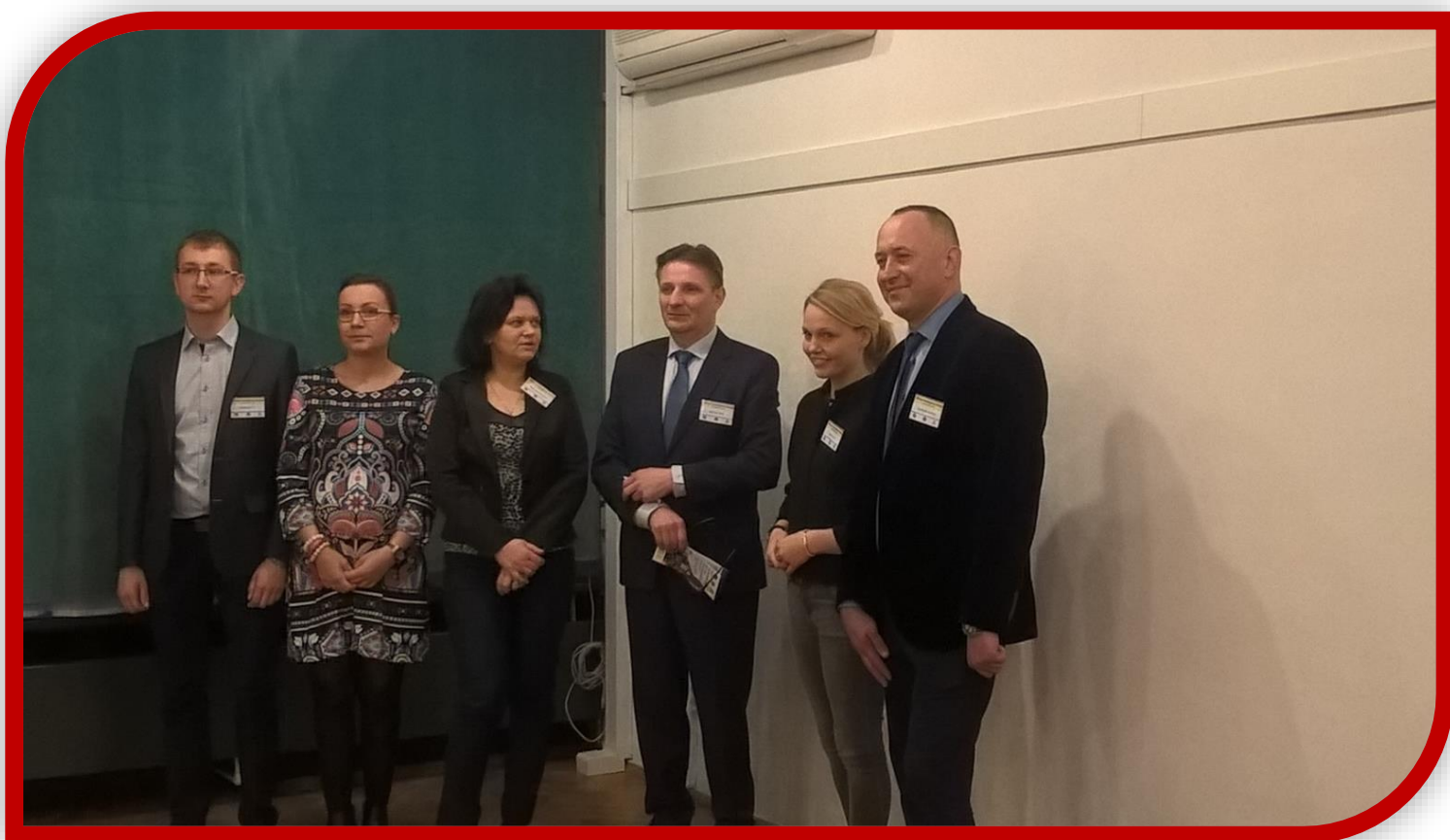
Fot.2. Rolnicy reprezentujący gospodarstwa