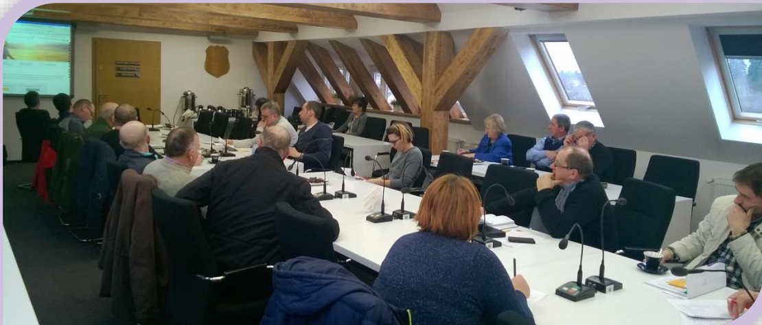
Fot.3. Uczestnicy szkolenia