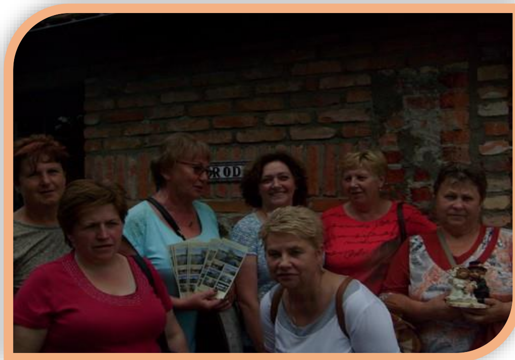
Fot.2. Uczestnicy seminarium z wizytą w „Siedmiu Ogrodach” w Łowiczu Waleckim