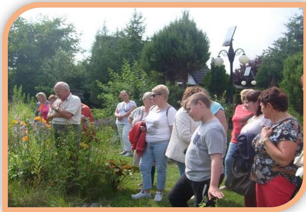
Fot.1. Uczestnicy seminarium z wizytą w „Siedmiu Ogrodach” w Łowiczu Waleckim