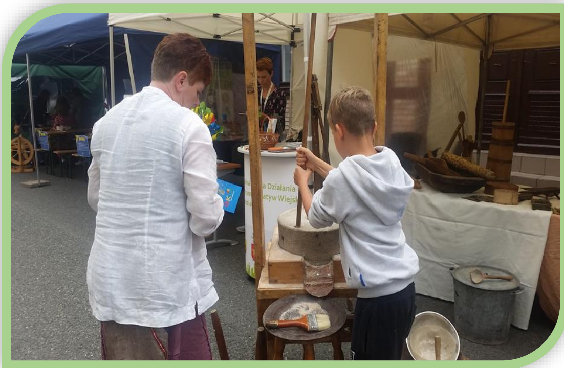
Fot.3. Uczestnicy warsztatów ekologicznych w Dobrej.