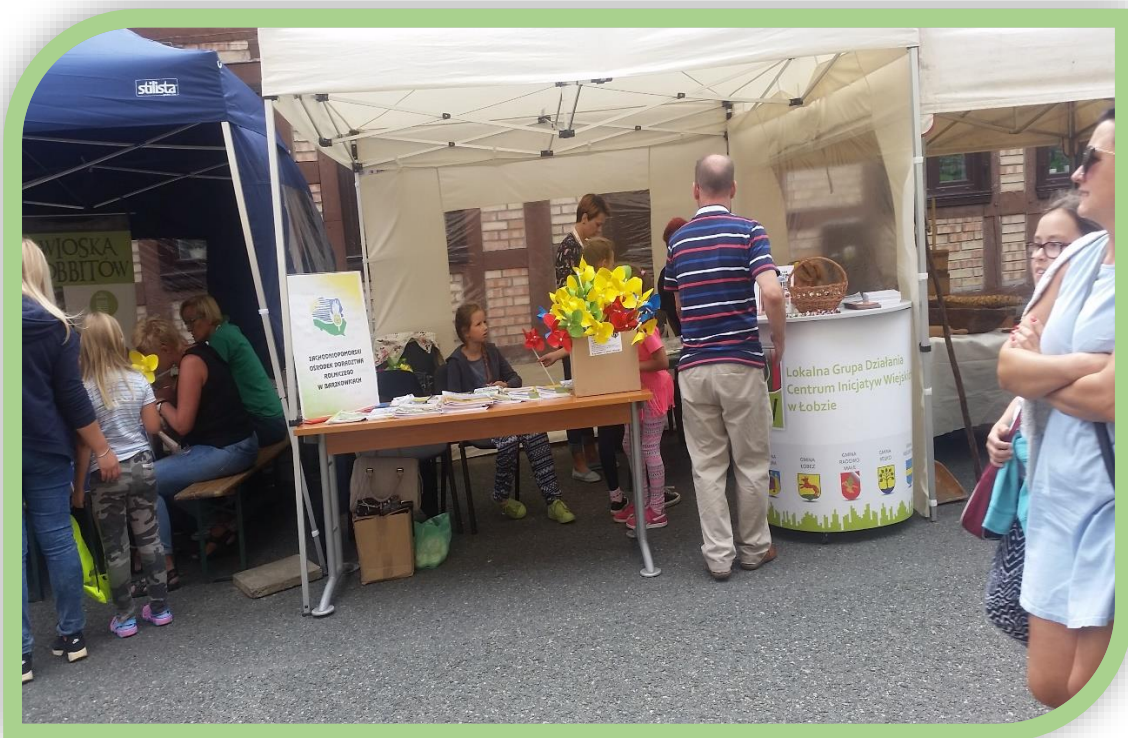
Fot.2. Stoisko Zachodniopomorskiego Ośrodka Doradztwa Rolniczego w Barzkowicach podczas Festynu Rodzinnego w Dobrej.