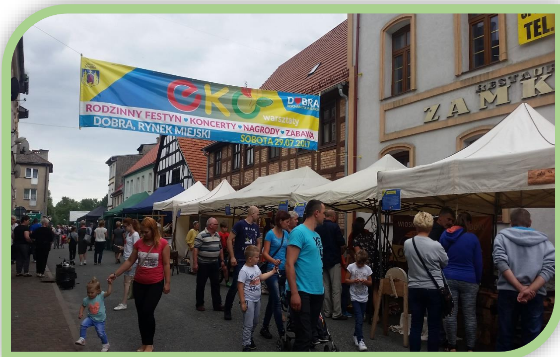
Fot.1. Warsztaty ekologiczne podczas Festynu Rodzinnego w Dobrej.