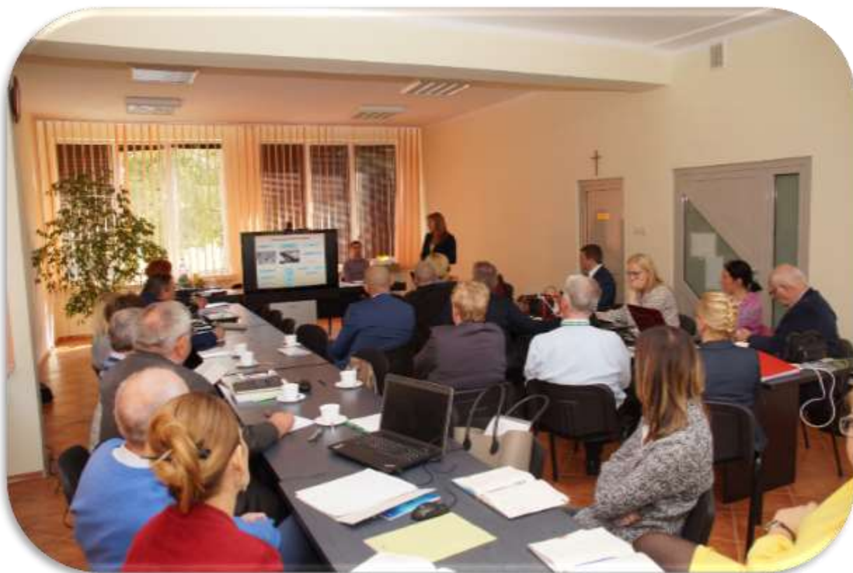
Fot.4. Uczestnicy szkolenia