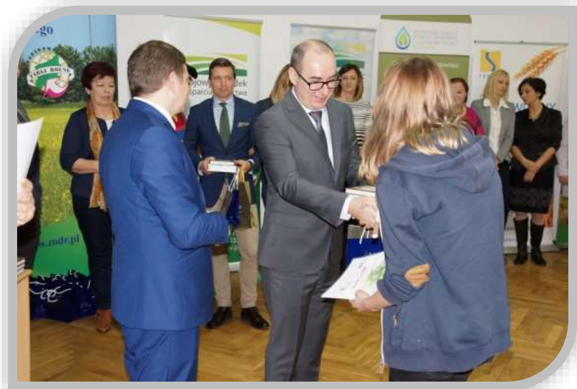
Fot.9. Wręczenie nagród uczestnikom XVI edycji Konkursu Wiedzy Ekologicznej