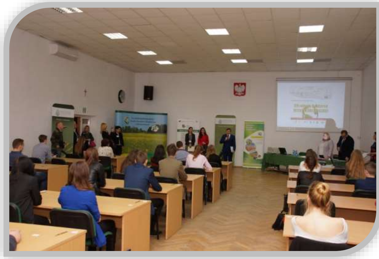
Fot.3. Pisemna część XVI edycji Konkursu Wiedzy Ekologicznej