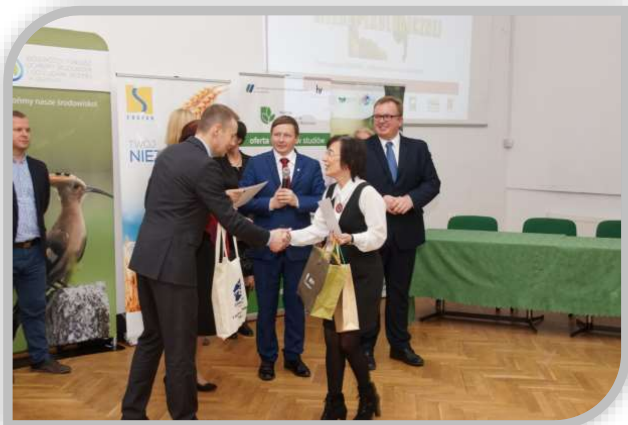
Fot.11. Podziękowania dla nauczycieli przygotowujących uczniów do XVI edycji Konkursu Wiedzy Ekologicznej