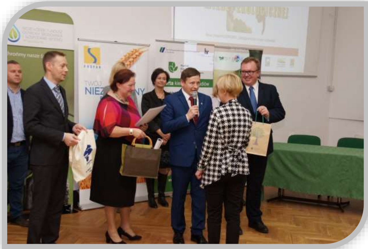
Fot.10. Podziękowania dla nauczycieli przygotowujących uczniów do XVI edycji Konkursu Wiedzy Ekologicznej