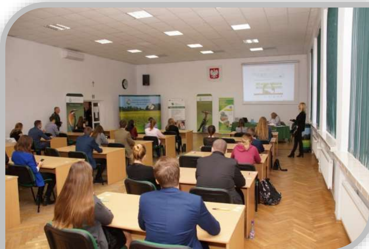
Fot.2. Pisemna część XVI edycji Konkursu Wiedzy Ekologicznej