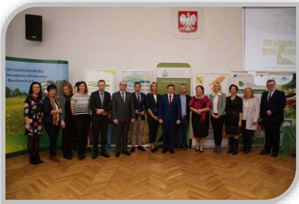
Fot.13. Zdjęcie grupowe organizatorów, współorganizatorów, partnerów oraz sponsorów nagród XVI edycji Konkursu Wiedzy Ekologicznej