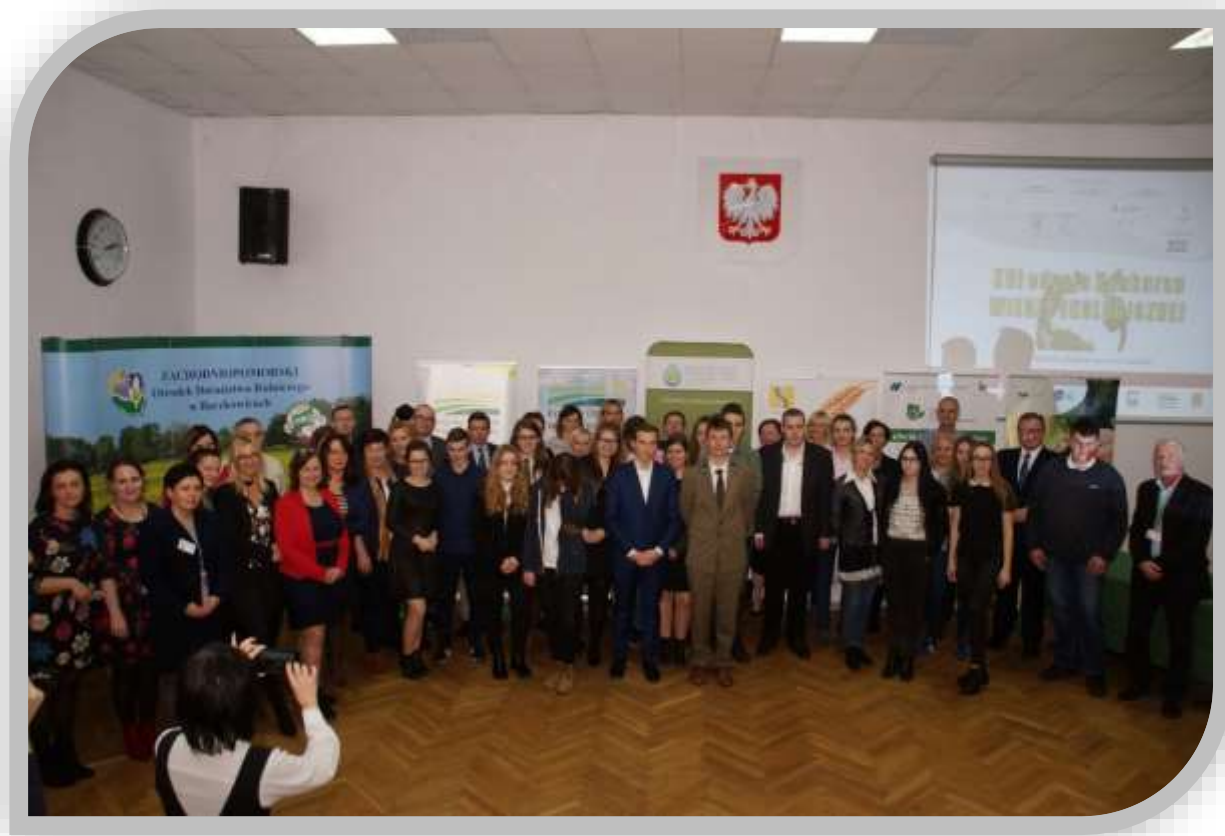
Fot.12. Zdjęcie grupowe uczestników, organizatorów, współorganizatorów, partnerów oraz sponsorów nagród XVI edycji Konkursu Wiedzy Ekologicznej