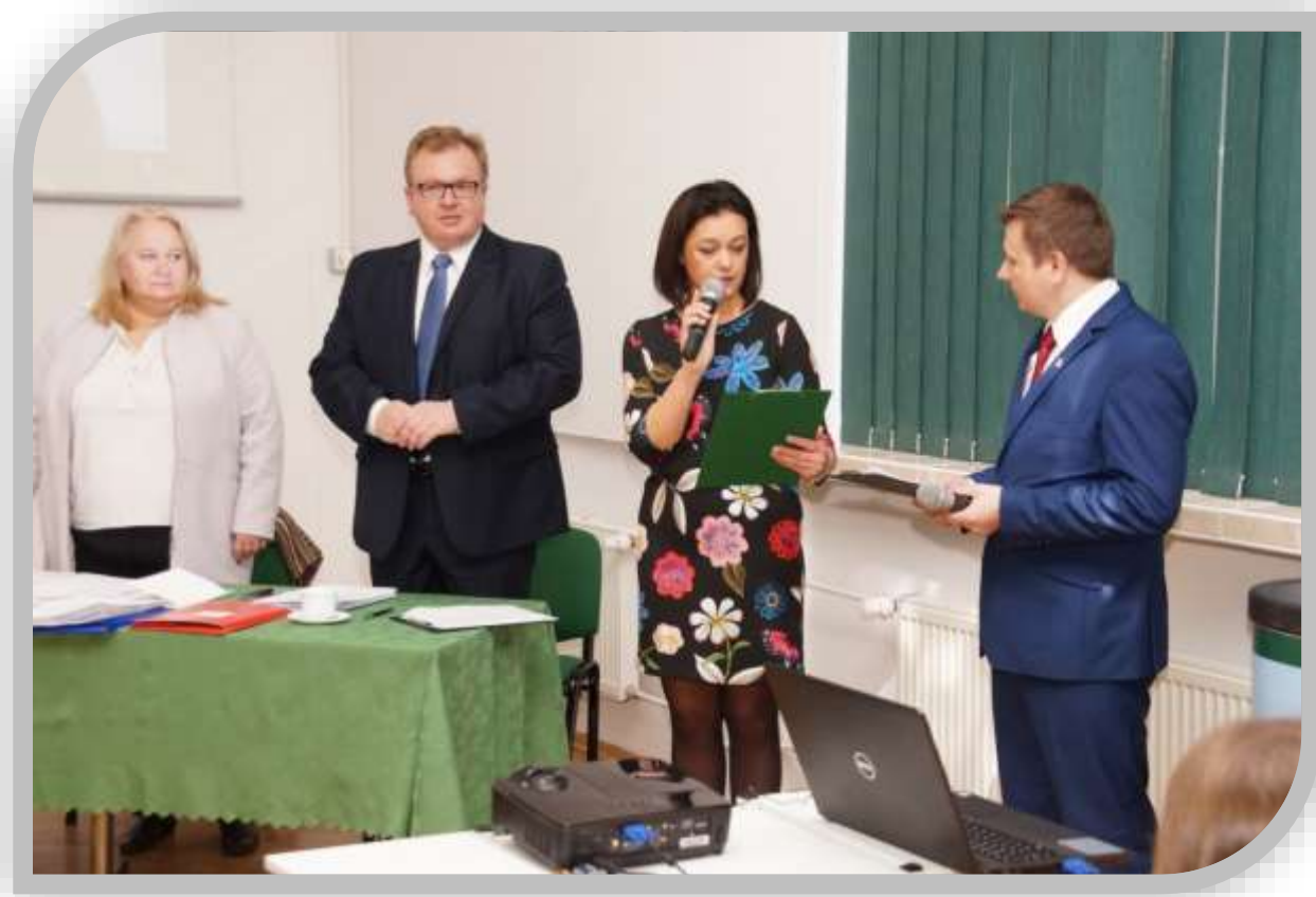
Fot.1. Oficjalne otwarcie finału XVI edycji Konkursu Wiedzy Ekologicznej