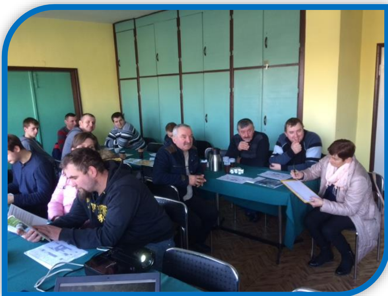
Fot.1. Uczestnicy szkolenia powiatowego w Łobzie

Rolnicy zostali zapoznani z informacjami dotyczącymi Polskiego Związku Hodowców i Producentów Bydła Mięsnego, który jako jedyny prowadzi księgi hodowlane w Polsce, jak również z jakością wołowiny kulinarnej i elementami mającymi wpływ na jakość produktu końcowego.