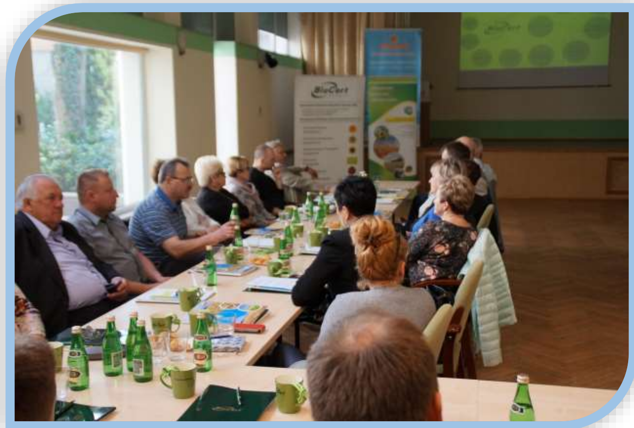
Fot.2. Uczestnicy konferencji