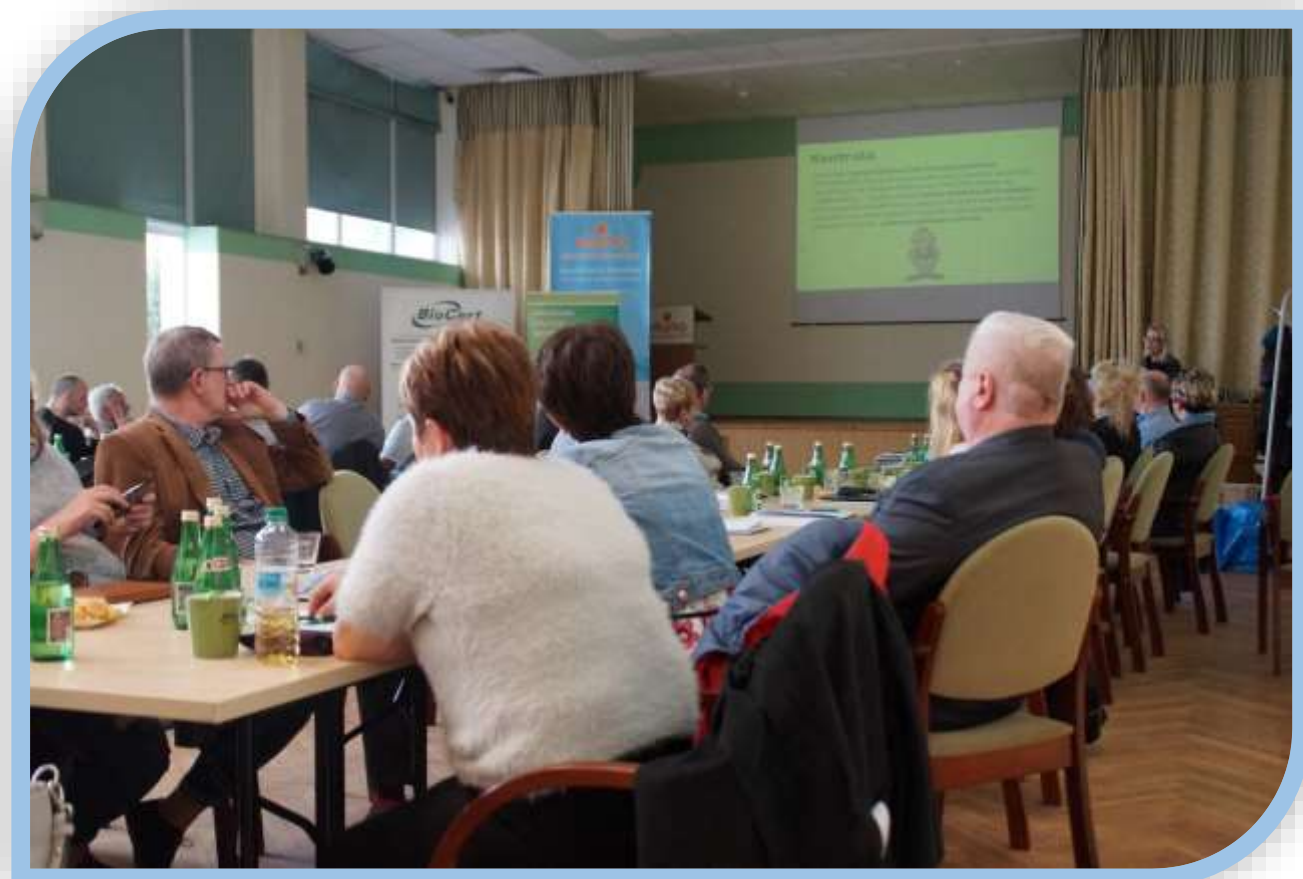
Fot.3. Uczestnicy konferencji