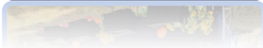
Fot.1. Występy zespołów ludowych podczas dożynek Gminnych w Borne Sulinowie