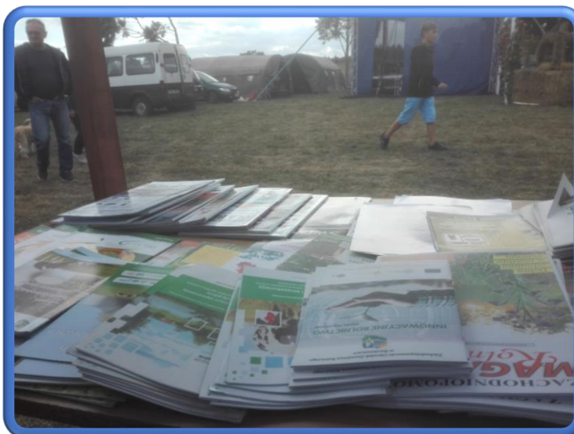
Fot.4. Prasa oraz literatura rolnicza na stoisku ZODR podczas Dożynek Gminnych w Bornem Sulinowie