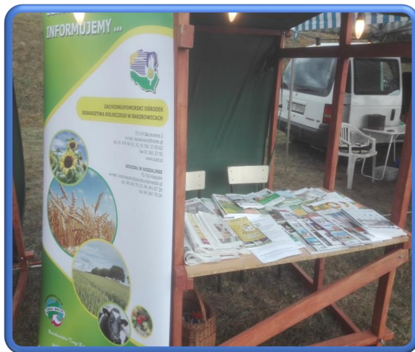
Fot.3. Stoisko Zachodniopomorskiego Ośrodka Doradztwa Rolniczego w Barzkowicach podczas Dożynek Gminnych w Bornem Sulinowie