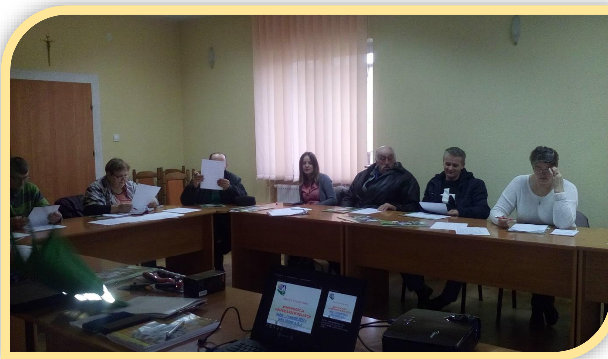
Fot.1 – Uczestnicy szkolenia