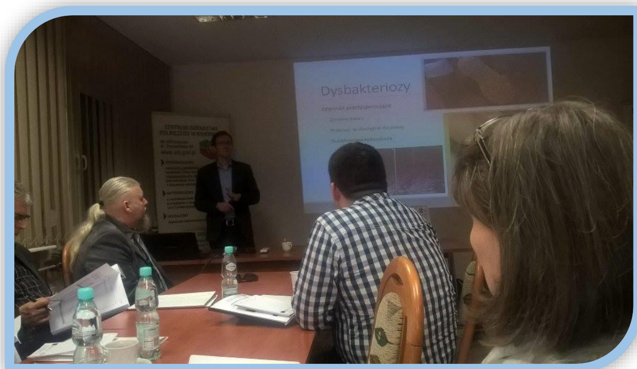
Fot.1. Prezentacja multimedialna