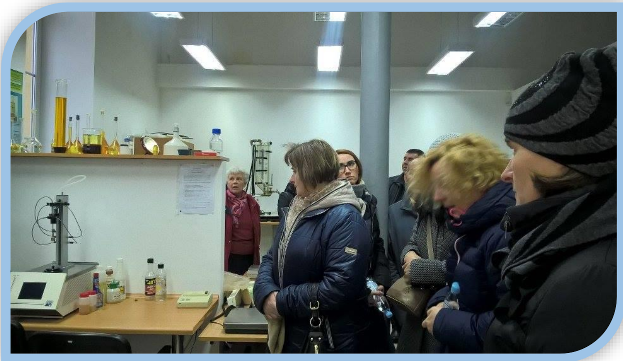
Fot.5. Instytut Technologiczno-Przyrodniczym O/Poznań