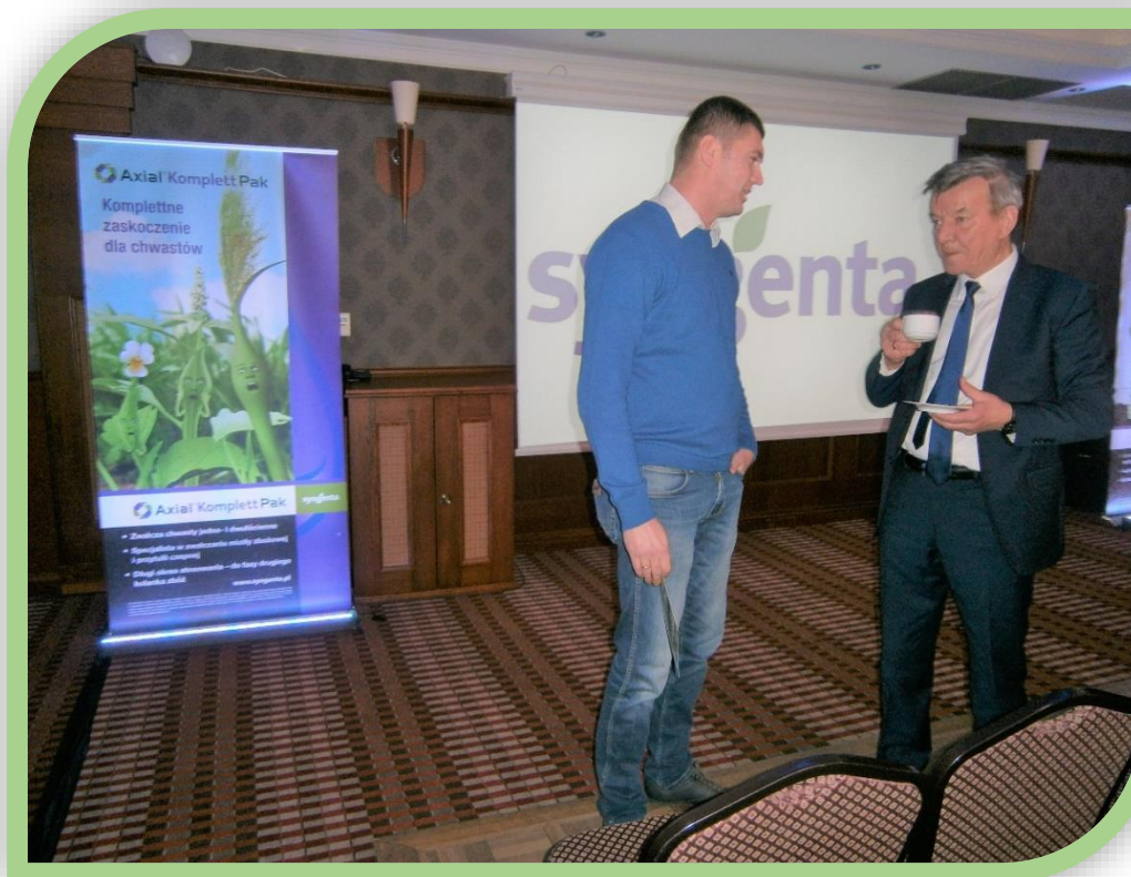
Fot.2. Przedsiębiorcy rolni